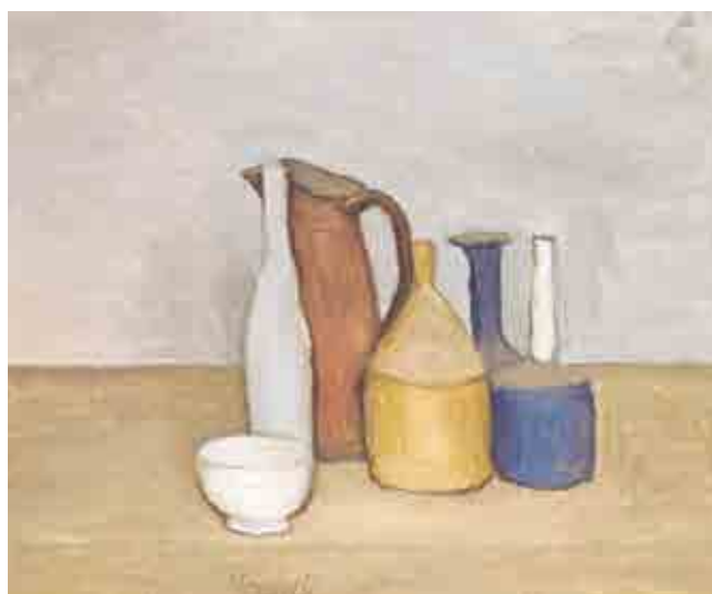
Giorgio Morandi, Natura morta, olio su tela, 35 x 50 cm Collezione privata