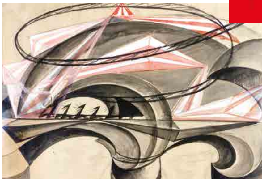
Giacomo Balla, Ponte della velocità , olio magro su carta, 68 x 96 cm Collezione privata

per qualità, varietà e vastità. Per il pubblico si tratta di un'occasione imperdibile per entrare virtualmente nelle più belle e inaccessibili dimore di Brescia e provincia e ammirare, in via del tutto eccezionale, opere di straordinario valore storico-artistico ritrovate dal curatore dopo anni di appassionate ricerche. Per la gioia degli occhi, del cuore e dello spirito!