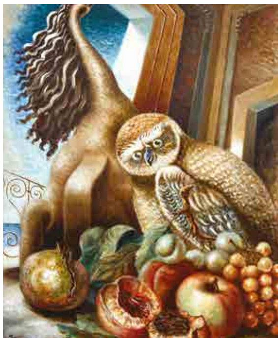
Alberto Savinio, Pensée et action , olio su tela, 73 x 60 cm Collezione privata