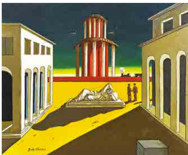
Giorgio De Chirico, Piazza d'Italia, olio su tela, 50 x 60 cm Collezione privata

Proponiamo una selezione di oltre cento opere, alcune delle quali inedite o mai esposte in pubblico prima d'ora che permetterà di esplorare le correnti e i movimenti artistici succedutesi nel corso dei decenni. Ai lavori dei più illustri pittori