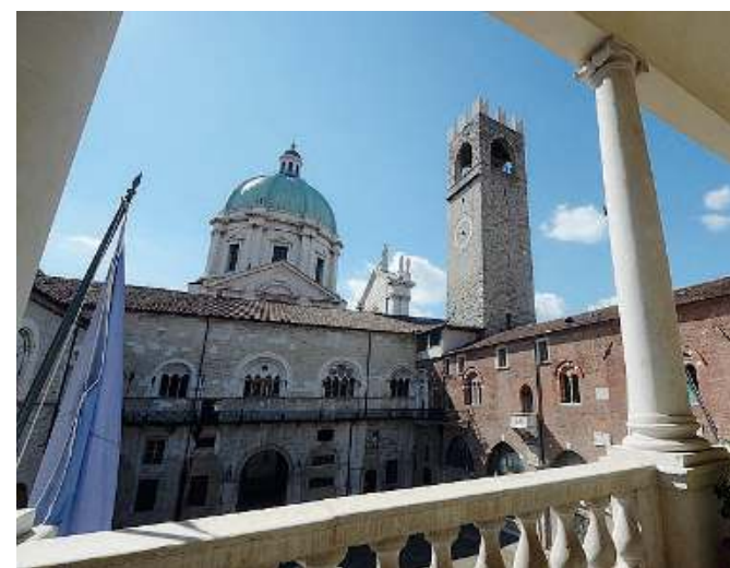
Palazzo Broletto. La sede della Provincia di Brescia

Le prime sessioni interessano le macroaree di Medicina e Ingegneria con oltre 550 appelli, di cui 281 esami scritti, calendarizzati da oggi al 30 aprile. //