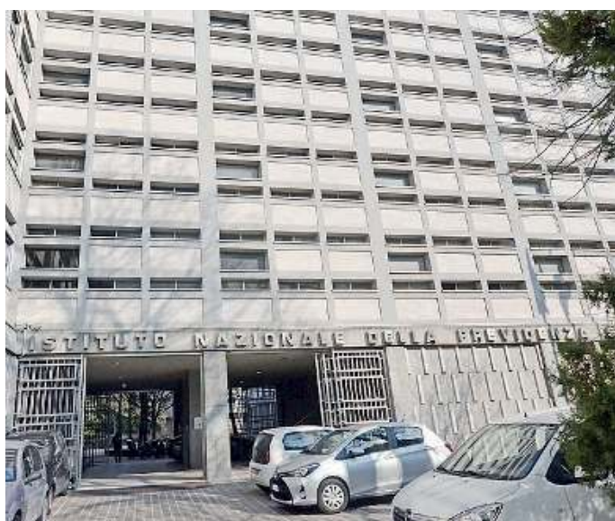
La sede. L'Inps provinciale di Brescia