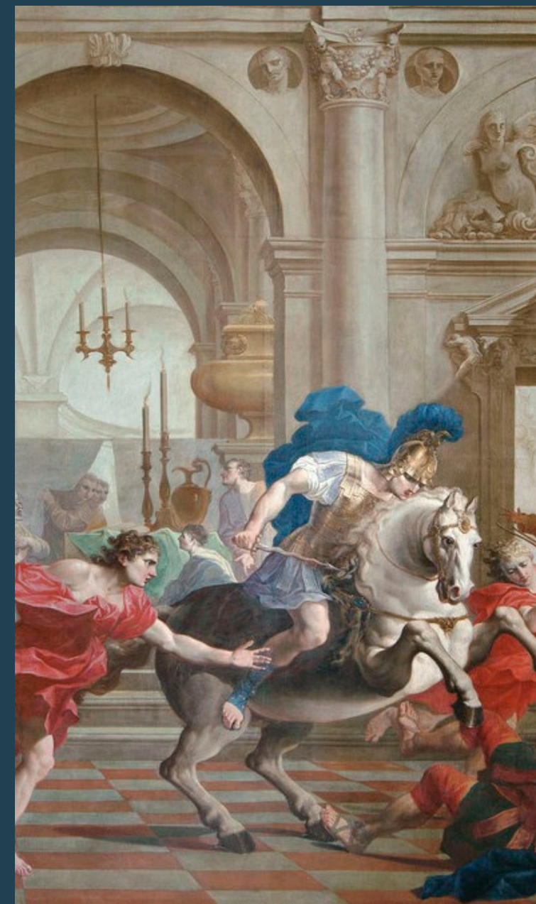
Particolare del restauro - Giuseppe Tortelli, La cacciata di Eliodoro dal tempio