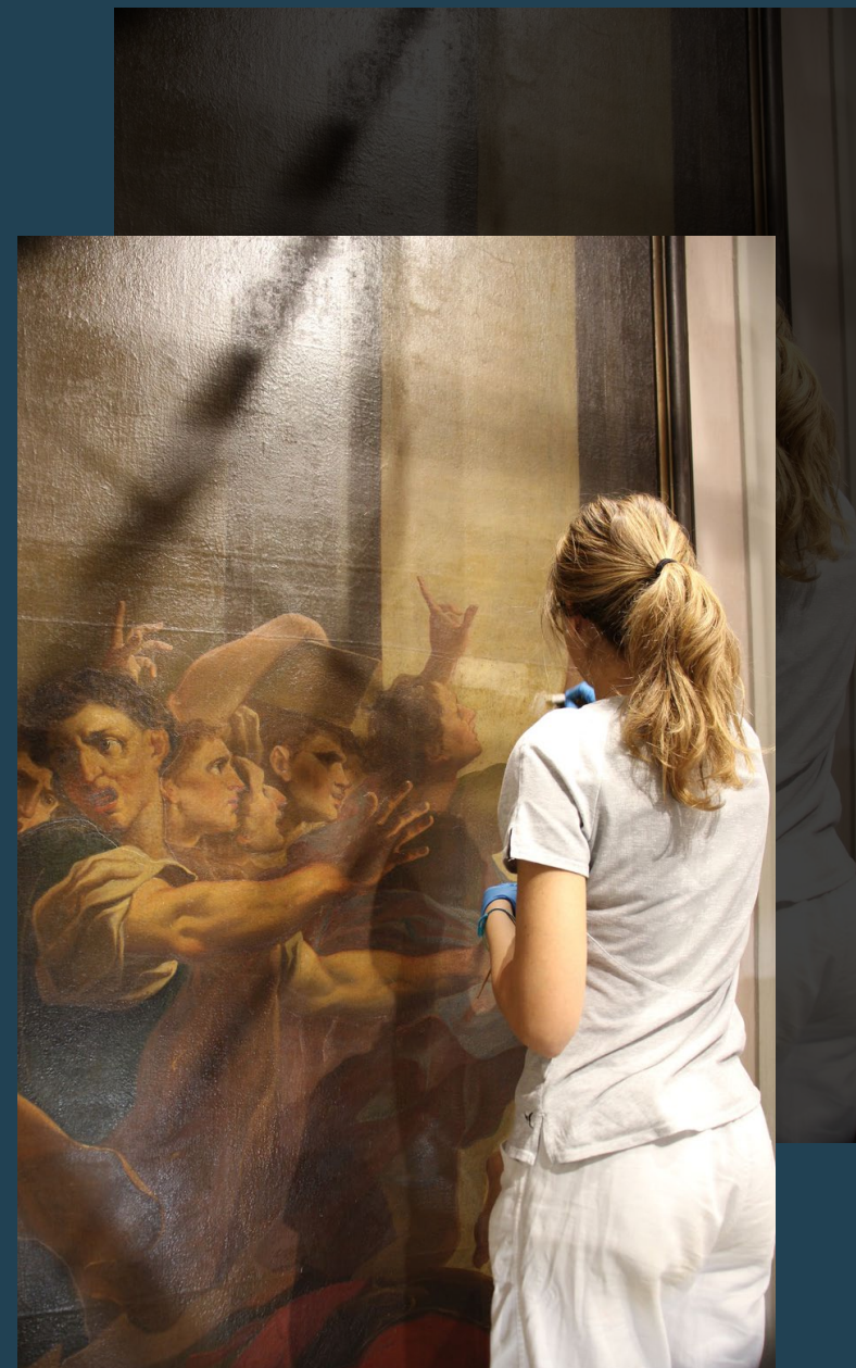
Particolare del restauro - Giuseppe Tortelli, La cacciata di Eliodoro dal tempio

Il Progetto Art Bonus dell'Anno ha l'obiettivo di offrire visibilità e riconoscimento agli enti promotori e ai loro donatori, rendendo i territori protagonisti grazie al voto espresso dai cittadini