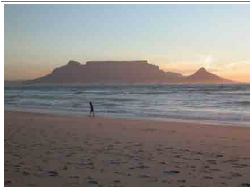
Cape Town - Spiaggia

internazionali IFRS e l'Ordine dei Commercialisti SAICA conta su 21.000 membri.