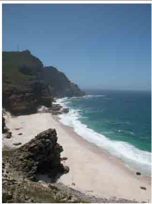
Cape Town - Oceano Atlantico

Il Sud Africa è un Paese in cui le occasioni di investimento sono enormi. Anzitutto è all'avanguardia in molti settori, qui esiste la certezza del diritto, il potere pubblico esiste e si dà da fare per agevolare l'investitore, dove la burocrazia è ridotta al minimo, dove le fatture si incassano a 30 giorni e dove lo Stato approva a Febbraio di ogni anno la Finanziaria, chiamata Budget, e contestualmente mette a disposizione i fondi per le opere pubbliche ivi previste. E' anche uno dei 5 Paesi del Club dei maggiori Paesi Emergenti, il BRICS, oltre ad essere nel Consiglio di Sicurezza dell'ONU. Ed è il Paese attraverso il quale entrare nel resto dell'Africa Sub-sahariana, un enorme mercato che sarà il centro degli investimenti dei prossimi anni. E che è alle porte dell'Italia, protesa nel Mediterraneo proprio verso il Continente Africano. Le imposte dirette sulle società sono al 28%, l'IVA al 14% e le persone fisiche sono tassate in proporzione al reddito, con un'aliquota minima del 18% e massima del 40% al corrispondere di R 617.000 (circa € 62.000) di imponibile, con sconti al compimento dei 65 anni di età e con un sistema di abbattimenti e oneri deducibili. Il sistema tributario è stato disegnato sul sistema europeo, per cui sono vigenti sia l'imposta sul capital gain che l'imposta di registro, le imposte di donazione e successione e le accise su tabacchi, liquori e benzina (che peraltro costa la metà che in Italia). Il sistema contabile è basato sui principi contabili