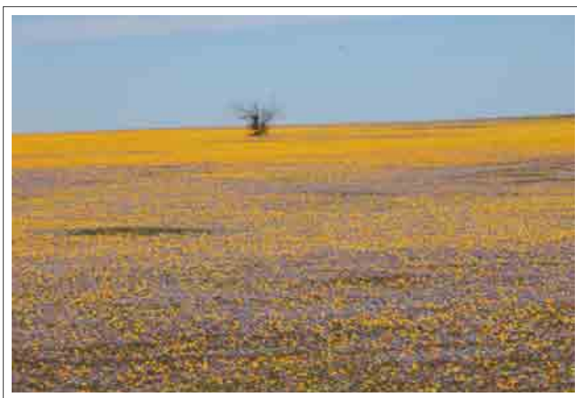
Il deserto del Namaqualand - in agosto... fiorisce... chilometri e chilometri di fiori