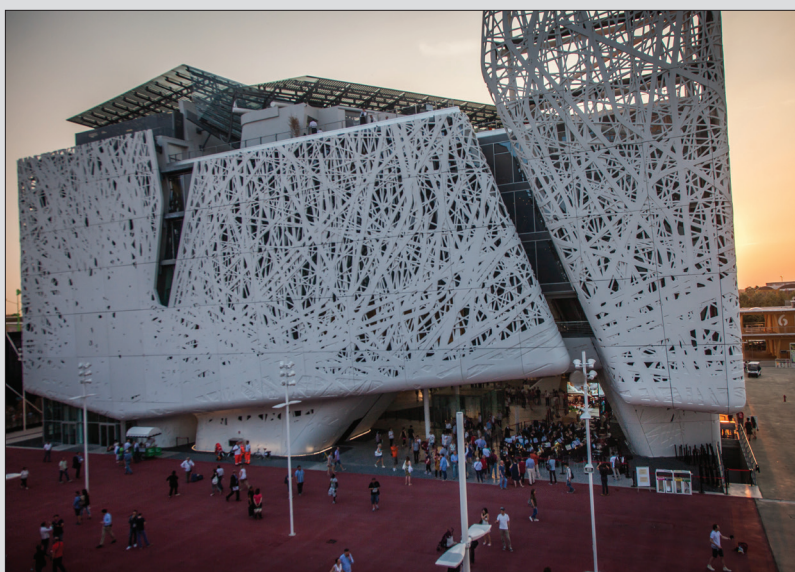
Il Padiglione Italia

La presenza di Brescia in Expo sarà scandita quindi da percorsi di cultura, cooperazione inter-