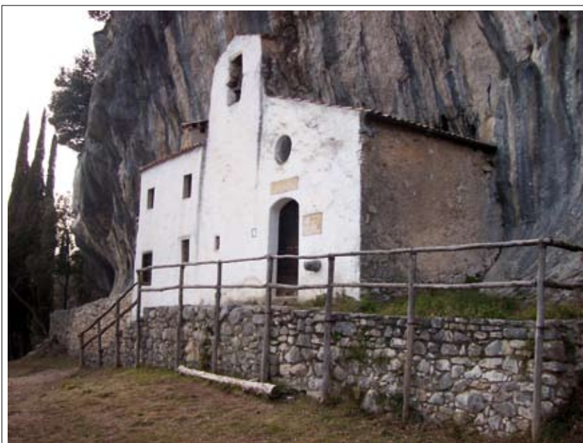
L'Eremo di San Valentino