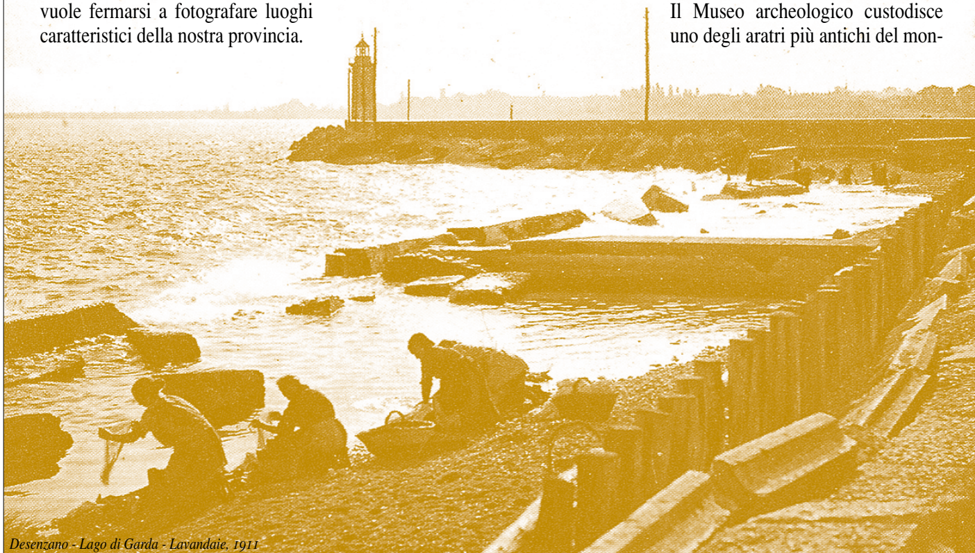
Desenzano - Lago di Garda - Lavandaie, 1911

Il Museo archeologico custodisce uno degli aratri più antichi del mon-