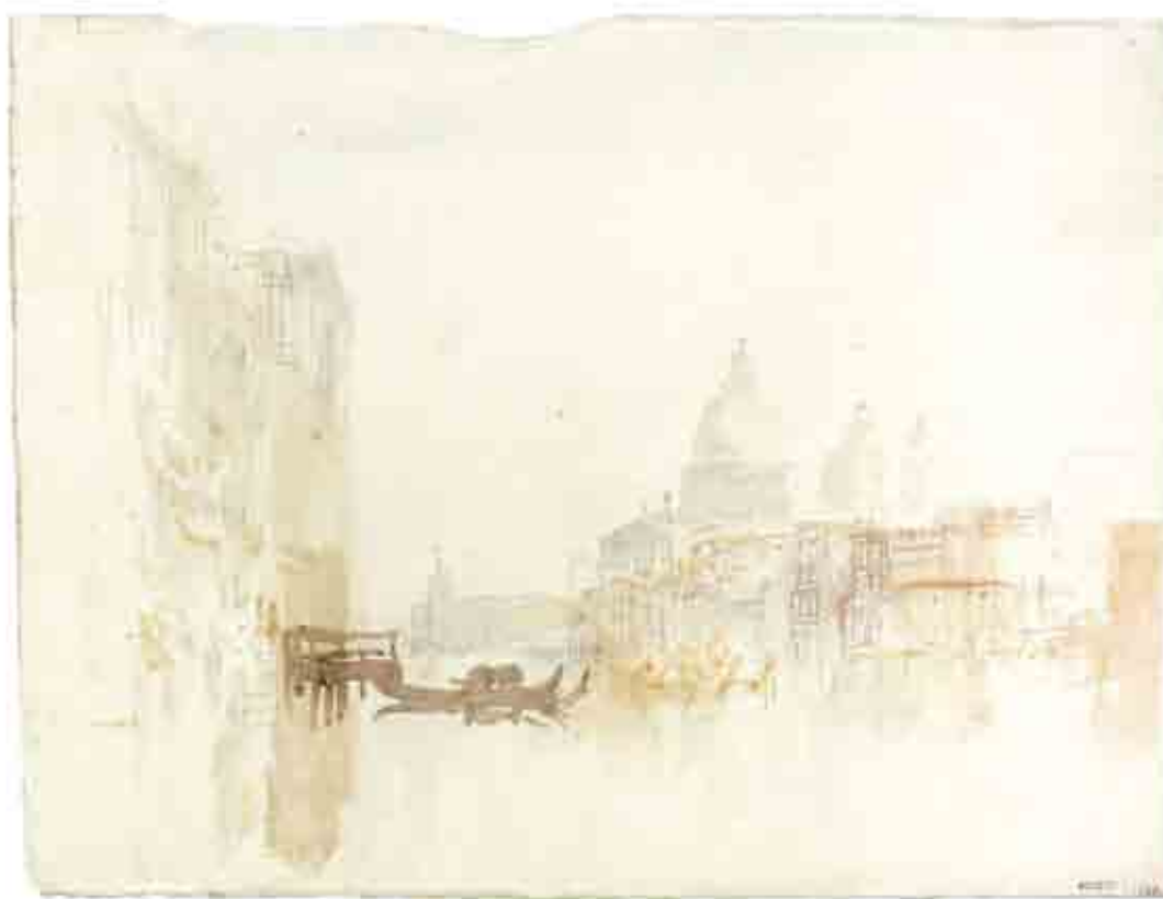
Turner, Santa Maria della Salute con il traghetto S. Maurizio, 1840

Se non fosse che ora Einstein non è più la frontiera delle certezze scien-